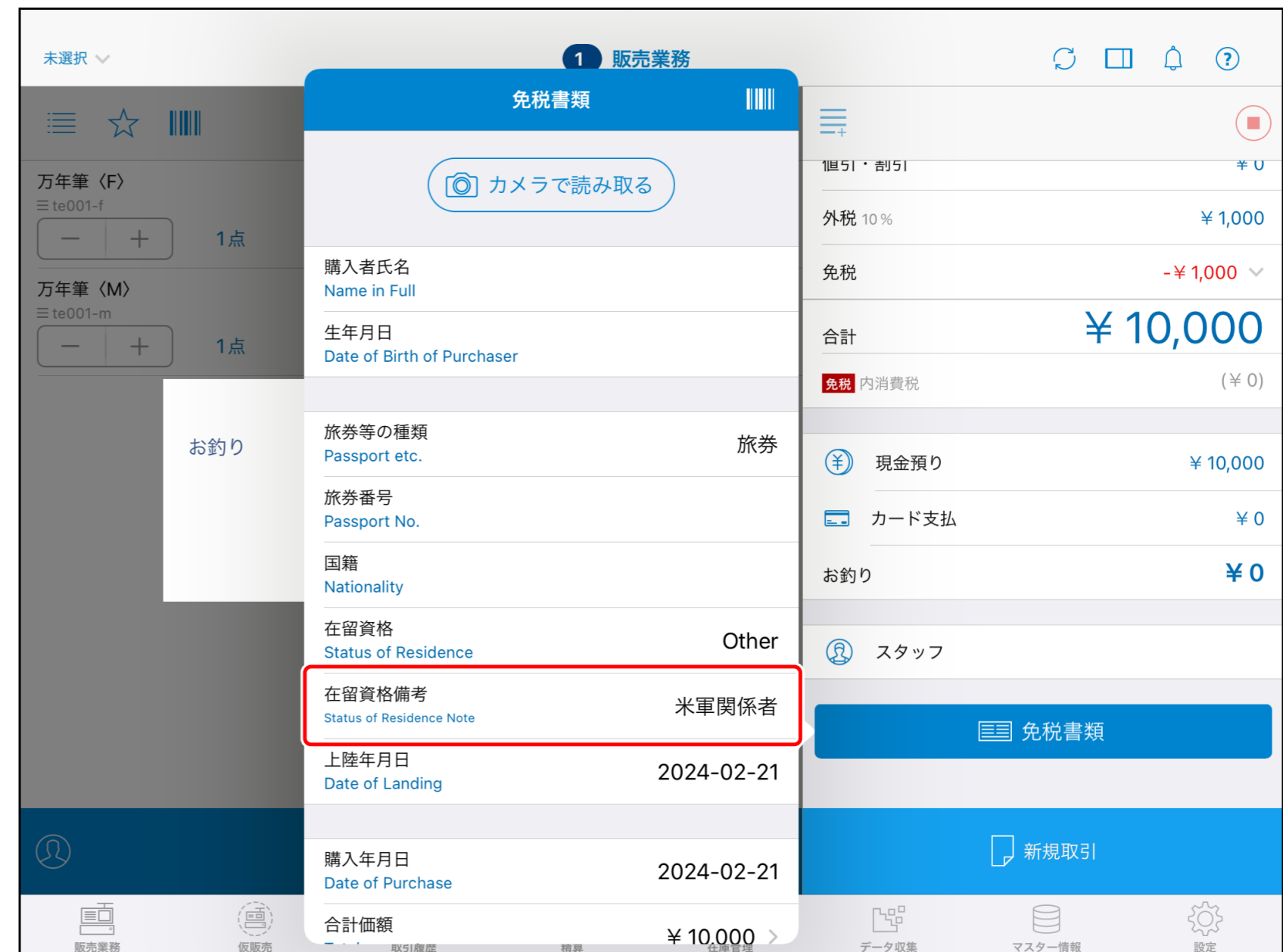
※画像は在留資格備考に米軍関係者と登録したイメージです