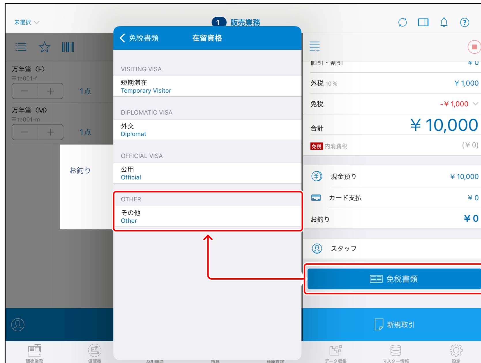
※画像は在留資格でOtherを選択したイメージです